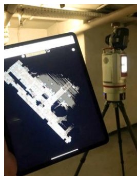
St. Stephen's cathedral / Vienna / 1000+ scan positions