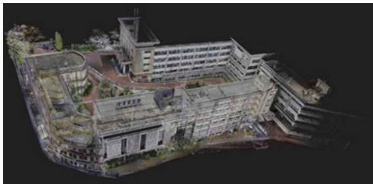
シュルード設計 Clear Points