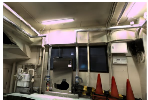
テクスチャ付きメッシュデータ

弊社では『点群処理ソフトウェア』及び『ハンディ 3D スキャナ』の体験セミナーを随時開催しております。また、気になる点や不明点等ございましたら以下の URL よりご質問ください。