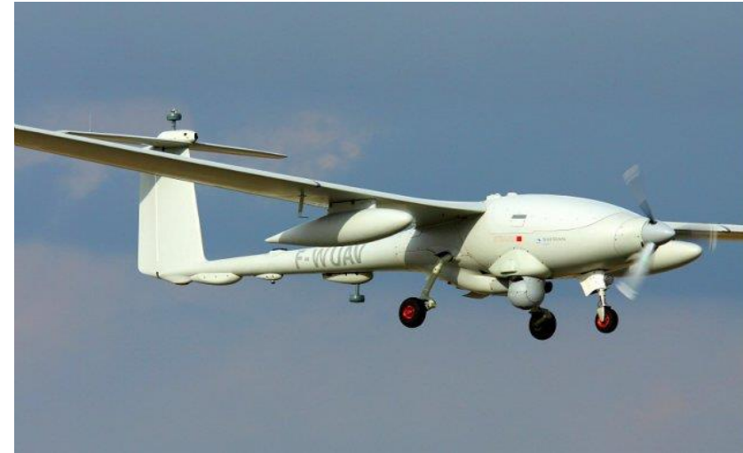
ポルトガル国防用UAV AIRBEAMプロジェクト