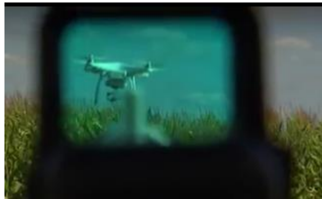
低価格でハンディなBattelle DroneDefender