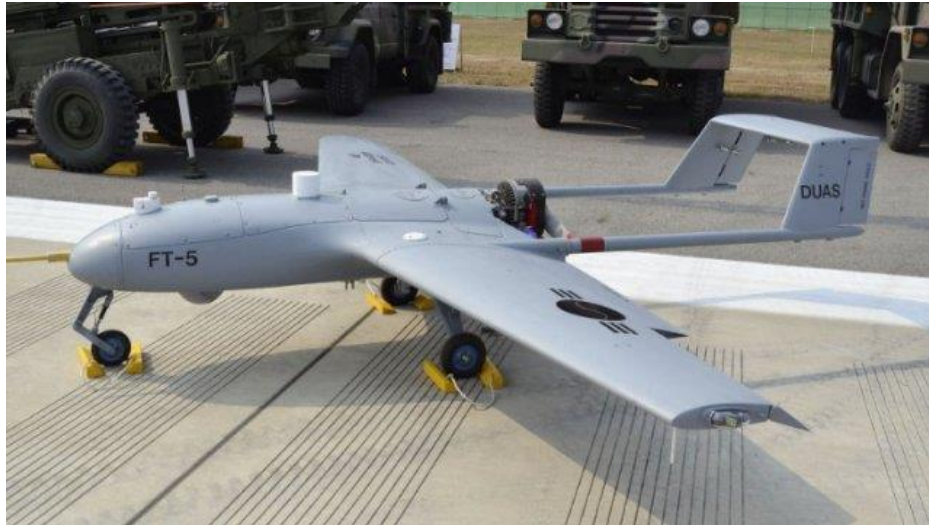
韓国軍の初の防衛用UAV KUS-FT